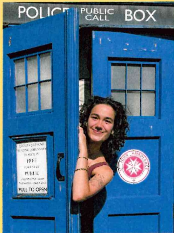
C'est moi !