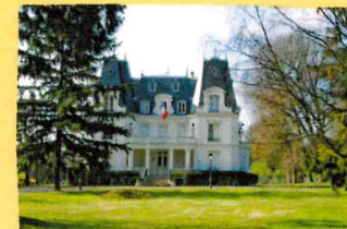
Bailly (Albion's Sister City)

I lived in Montreal (Canada) for three years, I love languages and speak Spanish. I will be your NSTA this semester and I am truly looking forward to that! About me, I read a lot, I like to draw and I know how to cook (pretty well, if you ask me). Don't hesitate to reach out if you have any questions or simply want to chat!