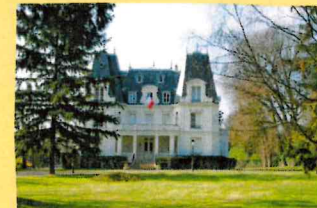
Bailly (la ville jumelle d'Albion)

J'ai vécu trois ans à Montréal (Canada), J'aime beaucoup les langues et je parle espagnol. Je serai votre NSTA ce semestre et j'ai vraiment hâte! À propos de moi, je lis beaucoup, j'aime dessiner et je sais bien cuisiner. Si vous avez besoin d'aide ou que vous voulez discuter, n'hésitez pas à me contacter!